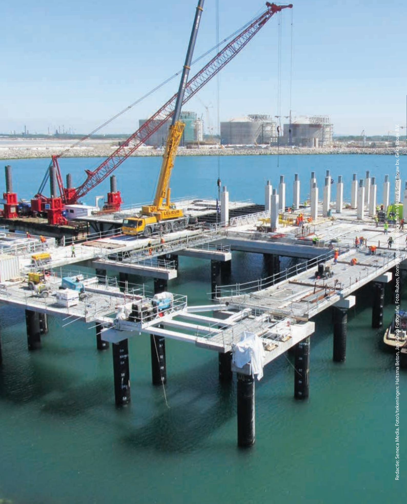
Redactie: Seneca Media, Fotos/tekeningen: Haitsma Beton, Jan Schot Fotografie, Foto Ruben, Ronny Benjaminis fotografie en Visser & Smit Bouw bv, Geke Bouw B.V.